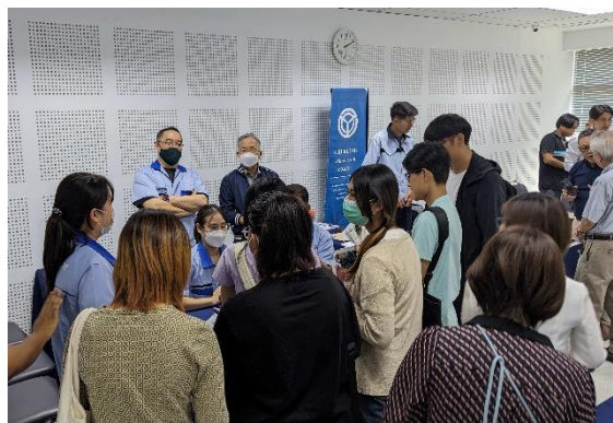
【学生と話す日系企業】